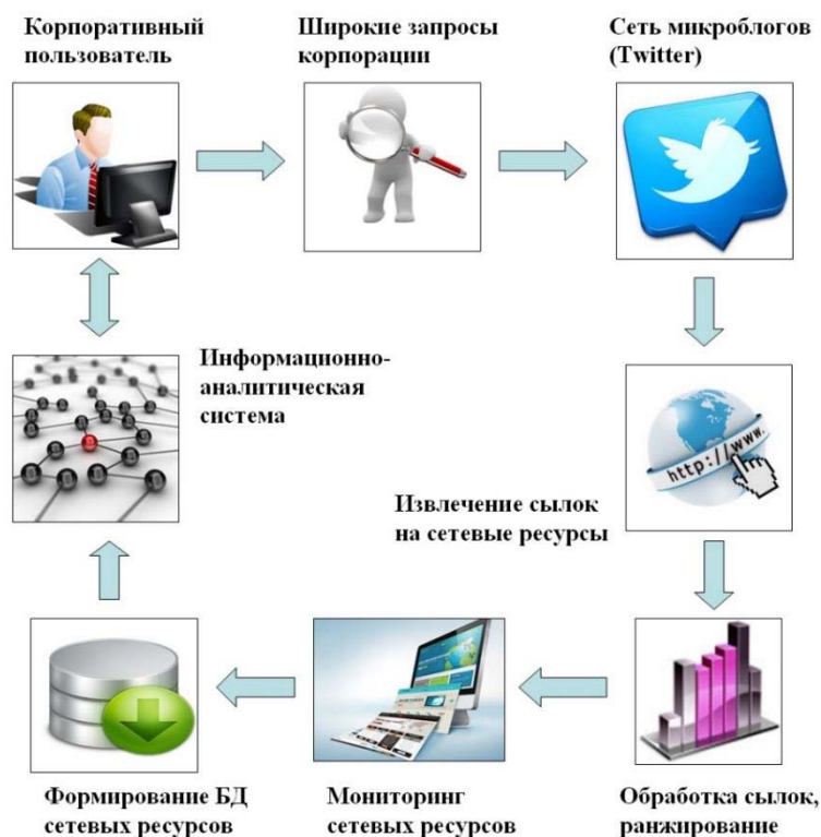
Рисунок 3 – Общая схема формирования базы данных корпоративной системы мониторинга сетевых информационных ресурсов

На основе полученной информации о распределении сообщений, на которые реализованы ссылки из сети микроблогов, предлагается следующая «краудсорсинговая» схема формирования базы данных корпоративной системы мониторинга сетевых информационных ресурсов (см. рис. 3).