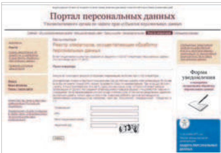
Рис. 1. Веб-ресурс российского регистратора операторов персональных данных