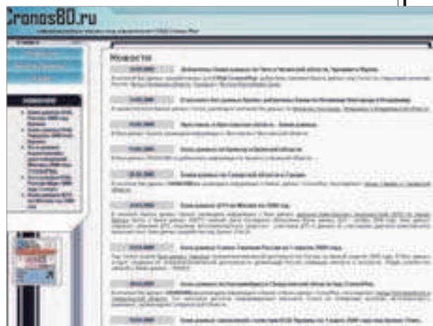
Рис. 2. Сайт в Интернете, где за плату предлагаются базы персональных данных, например, база данных водительских удостоверений

Ситуация с защитой персональных данных в нашей стране по ряду причин требовала срочного правового вмешательства, создания отдельного законодательного акта. В марте 2006 года Верховная Рада Украины принял закон «О защите персональных данных», однако, этот закон был вето Президентом В. Ющенко, в частности, на том основании, что он не был согласован с Конвенцией Совета Европы. 9 января 2007 года проект в обновленной редакции с учетом предложений Президента был одобрен Верховной Радой. Однако затем без специальных обоснований Президент снова использовал свое право вето.