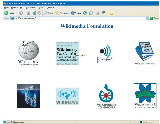
Среди новых проектов — Вики-словарь, Вики-цитатник, Вики-программные коды, агентство «Вики-новости» и др.

Сегодня Wikimedia Foundation создает новые проекты, развивая не только основные направления Википедии. Среди таких проектов, со-